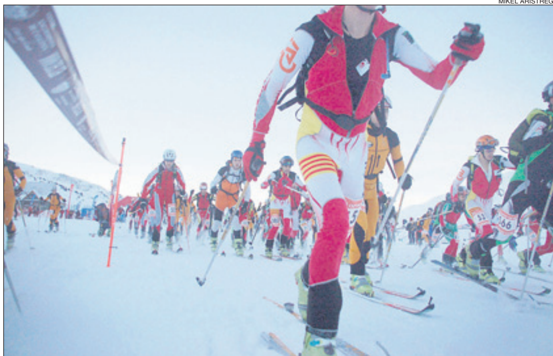
La cursa tenia un recorregut de 12 quilòmetres.