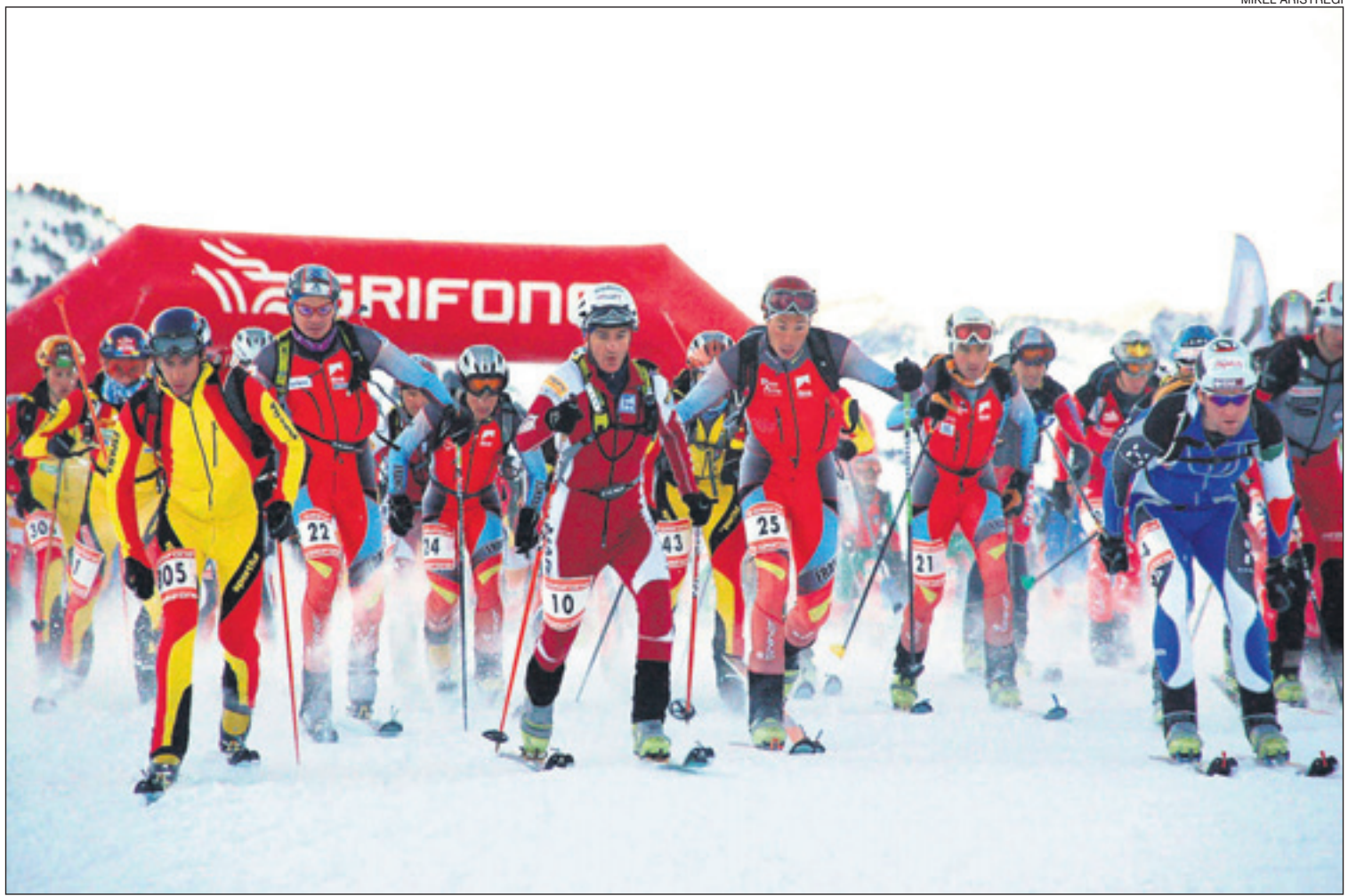
Durant la sortida és el moment de començar a buscar llocs de privilegi per no quedar-se tancat.

El bon temps va marcar la cursa, celebrant-se la prova sota unes condicions climatològiques i de neu immillorables, amb grossors per sobre del mig metre. Un dia immillorable per passar-lo esquiant pels blancs paratges de la Vall d'Aran. Participants, familiars i espectadors van gaudir del bon temps al mig d'un ambient festiu on no van faltar banderes i crits d'ànim per als participants de la prova del Naut Aran.